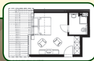
Doppelzimmer (separat buchbar)