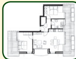
Ferienwohnung ohne Doppelzimmer